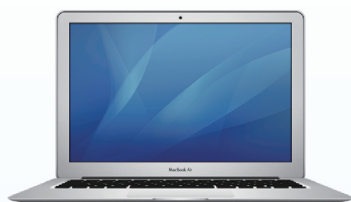
Apple MacBook Air