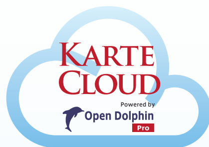
電子カルテ クラウドサービス

初期費用：24万円から (ハードウェア機器 + Karte Cloud初期設定費用)